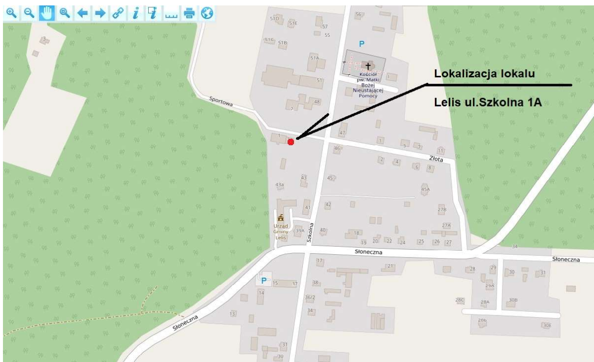
Mapa z lokalizacją obiektu

Pierwotne przeznaczenie lokalu: budynek przystanku autobusowego z poczekalnią i zapleczem sanitarnym